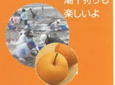
潮干狩りも 楽しいよ