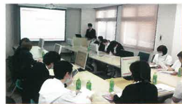
睡眠セミナーの様子